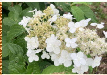
ノリウツギ（別名：サビタ） アイヌ語名（屈斜路地域） オプサ [ <op（槍）-sa（前） ]