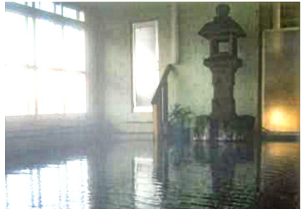
仁伏温泉の旅館にある浴槽右奥に鎮座する古びた石燈籠は、電気がない時代に灯りが灯されたのであろうか。

しようもなかったに違いない。「戸籍」のしつかりしたトヨを身のそばに置きたかったのだろう。