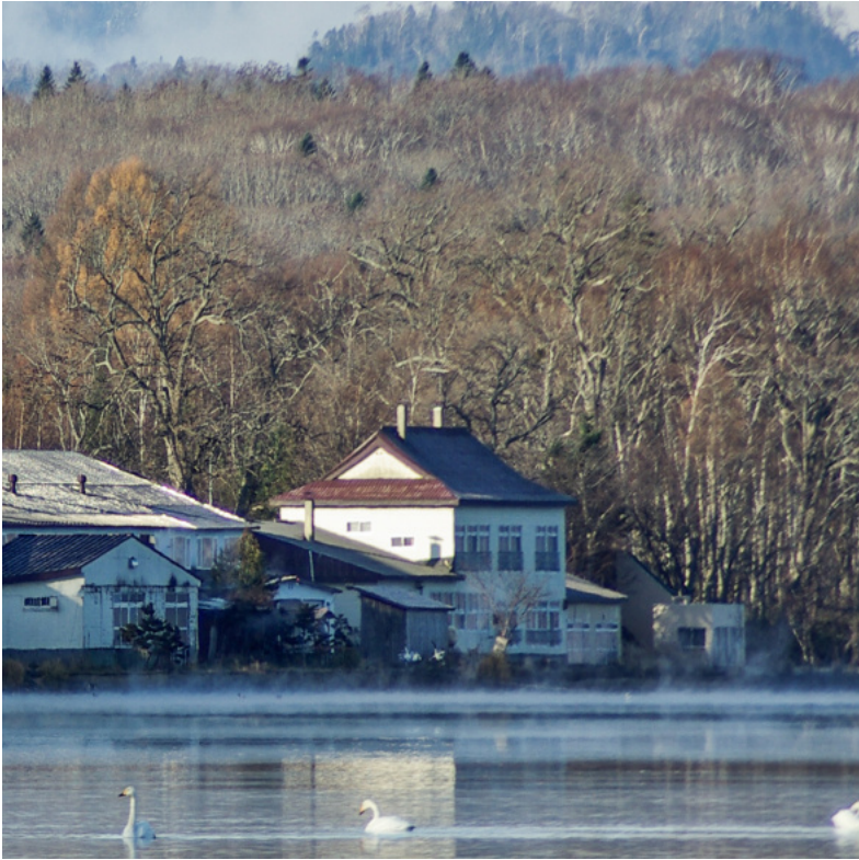
仁伏温泉。その歴史は古く明治31年に開湯した。温泉名の仁伏（ニブシ）とは、アイヌ語で木が割れ裂ける音のことで、樹木も割れるほど寒いと云う意味に由来する。 現存する入母屋造りの屋根の建物は、旧弟子屈営林署仁伏保養所（昭和17年に仁伏湖畔ホテルを買収）。 平成16年撮影

女性がいだが、逃亡生活で戸籍を持たない二人にとつては単なる共同生活者に過ぎない。 トヨを養女に迎えたのは何かの仕事をするにも土地を買うにも無戸籍ではどう