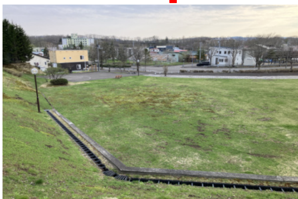
現在の「湯の島公園」

弟子屈町内を流れる釧路川の河川改修事業は昭和五三（一九七八）年から始められ、現在の姿になった。写真の箇所は、現在「湯の島公園」となっているところだ。