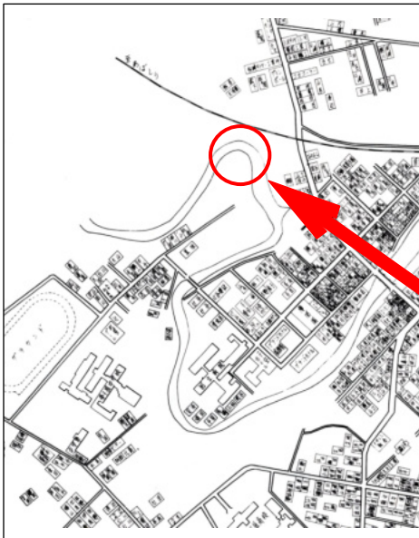
「昭和49年の弟子屈市街図」 『弟子屈町商工のあゆみ』から