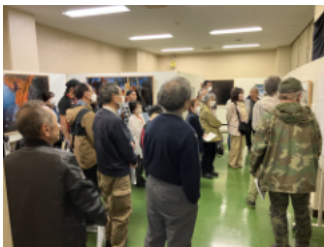
解説を聞く来場者