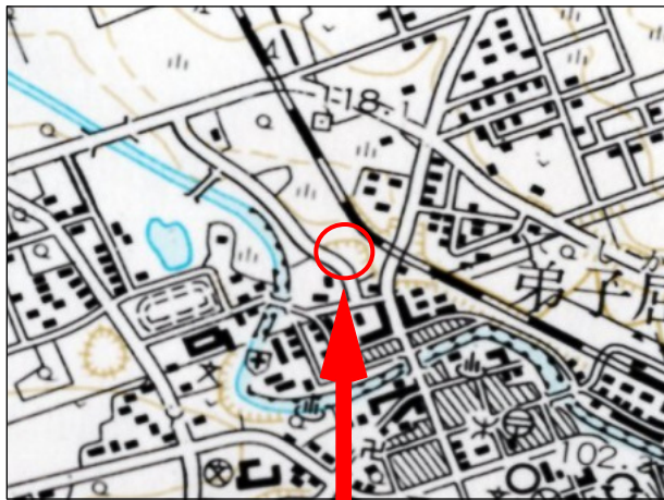
「弟子屈町全図」から