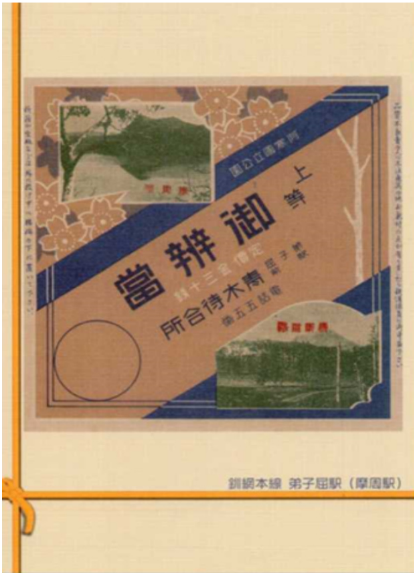
配布資料①青木待合所(弟子屈駅)の駅弁掛け紙